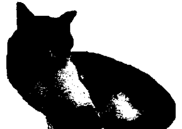
キジ白 (キジトラ+白)