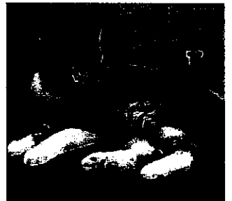
サバ白 (サバトラ+白)